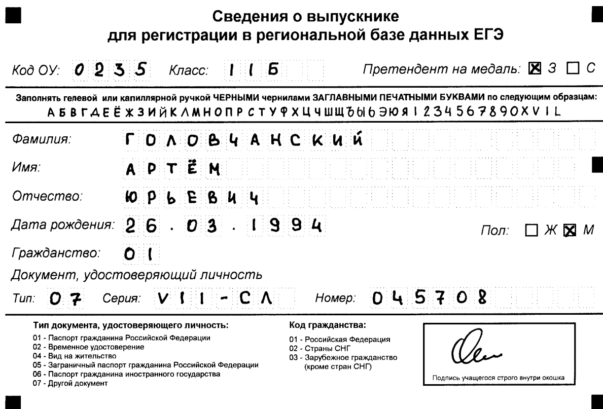
Рисунок 2. Бланк регистрации в РБД ЕГЭ, заполненный выпускником.

Пример заполненного выпускником бланка сбора сведений о выпускниках приведен на рисунке 2.